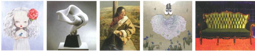
展出作品。 Exhibited works. 出展作品。

「2012台北新藝術博覽會」も、「台湾の若手芸術家と、芸術界新スターのタマゴの両者が中心」とのテーマを引き継ぎます。芸術家を招待し直接会場で来場者との交流を図り、芸術家の源である創作精神を来場者に聞いてもらいます。